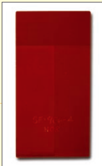
NELLA FOTO A LATO, IL PANNELLO DI RIVESTIMENTO DI UN FABBRICATO AD USO INDUSTRIALE. LA PARTE DI SINISTRA RISULTA SCOLORITA DOPO SOLI TRE ANNI DI ESPOSIZIONE AL SOLE E ALL'AZIONE DEGLI AGENTI ATMOSFERICI.

le "nascoste". In tal modo si possono eliminare tutte le eventuali problematiche, come accumuli di sporcizia, accumuli di foglie nelle gronde, piume di uccelli, piccoli insetti e così via. In questi casi, una pulizia con detergenti neutri è sufficiente per riportare allo stato originale le superfici. In caso di danneggiamenti meccanici con abrasione dello strato di vernice, invece, sarà necessario effettuare un ritocco sovraverniciando il difetto, seguendo con attenzione le istruzioni date dal fornitore. A