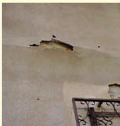
TANTO NELLE APPLICAZIONI CIVILI QUANTO IN QUELLE INDUSTRIALI, CON IL PASSARE DEGLI ANNI LE PARETI IN CEMENTO SONO SOGGETTE AD UN PROGRESSIVO DETERIORAMENTO.